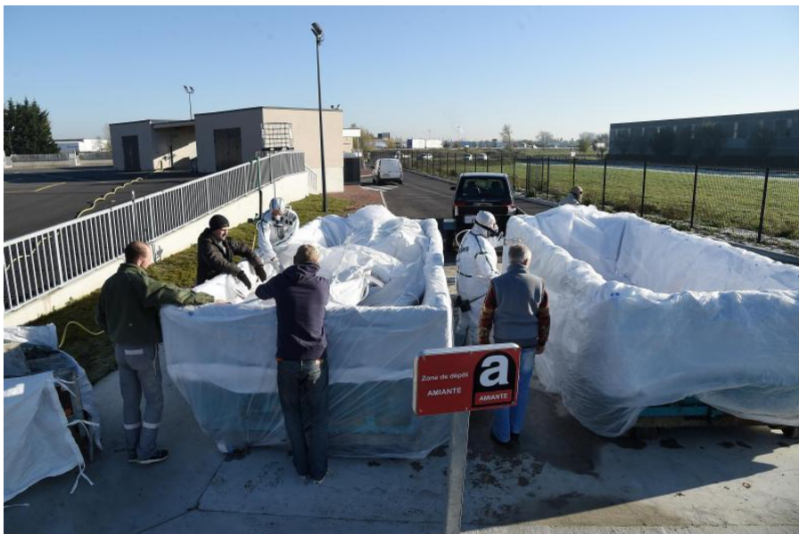
Seule la déchetterie de Bailleul peut désormais accueillir les déchets amiante.

Le nouveau dispositif, qui n'est pas destiné aux professionnels, est plus contraignant. Mais aussi beaucoup plus protecteur. Avant sa mise en place, l'amiante était un déchet comme les autres qui pouvait être déposé à tout moment de la journée. Désormais, ces déchets dangereux doivent être emballés par les usagers. Les agents du SMICTOM qui les traitent portent une tenue de protection et utilisent un sas de décontamination composé de deux douches et cinq pièces. Ils ont suivi une formation et ne sont pas exposés à l'amiante plus de 2 h 30 d'affilée.